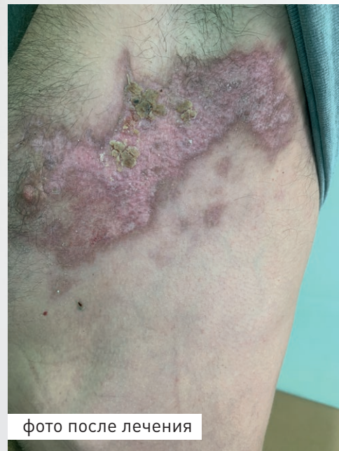
фото после лечения