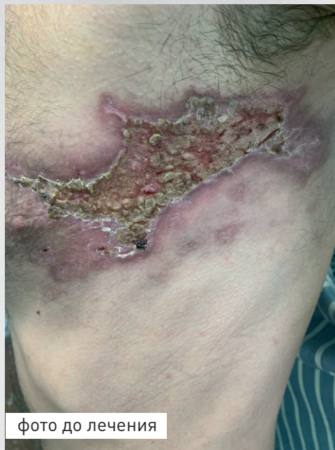
фото до лечения

Валацикловир 500 мг по 1 таб. 2 раза в день Фуцидин® крем 3-4 раза в день до 10 дней